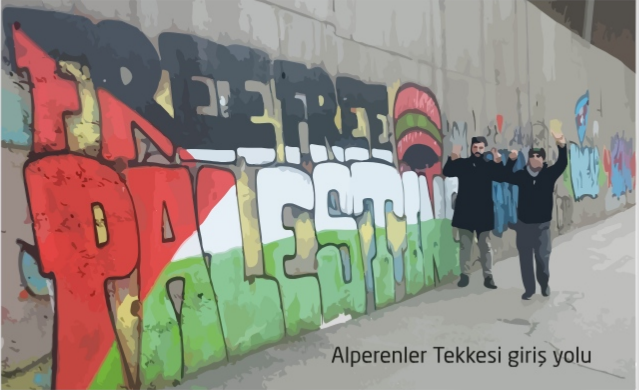
Alperenler Tekkesi giriş yolu