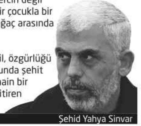
Şehid Yahya Sinvar

Bıraktığım şey ferdi bir miras değil, özgürlüğü hayal eden her Filistinli için, omzunda şehit çocuğunu taşıyan her anne için, hain bir kurşunla katledilen kızını acıyla yitiren her baba için ortak bir mirastır.