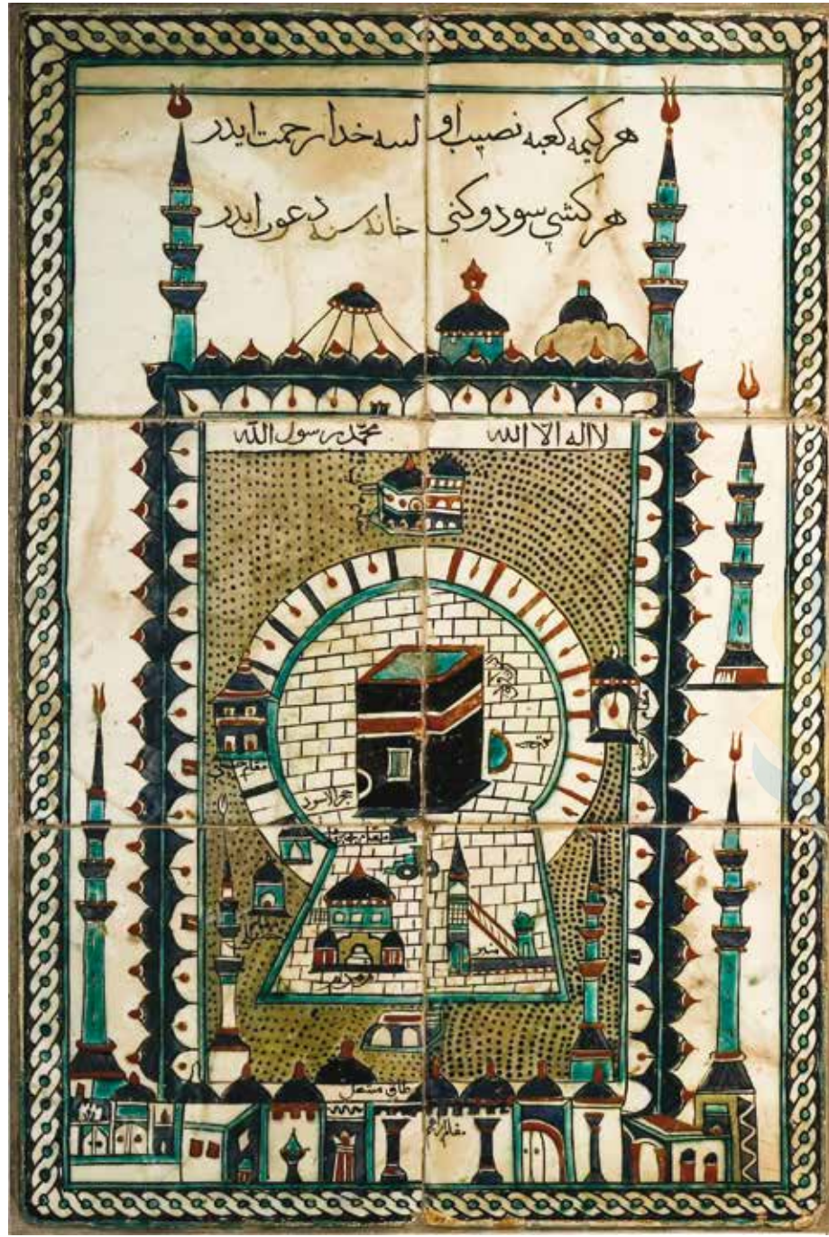
» Üzerinde Osmanlı Türkçesiyle "Her kime Kâbe nasib olsa Hüda rahmet ider / Her kişi sevdiğini hanesine davet ider" yazılı Kâbe tasvirli bir çini pano.

Hz. Peygamber ilk olarak Müslümanların Beytülmağdis'i fethedecekleri müjdesini verdi. Örneğin, hicrî 58 (milâdî 678) yılında vefat ederek Beytülmağdis'teki Rahmet Mezarlığı'na defnedilen Şeddad bin Evs (ra) şunları söylemiştir: "Şam fethedilecektir, Beytülmağdis fethedilecektir. Allah'ın izniyle, sen ve çocukların bu fetihle oraya imam olacaksınız." Hicrî 9. yıldaki Tebük Gazvesi (m. 630) sırasında da Resu-