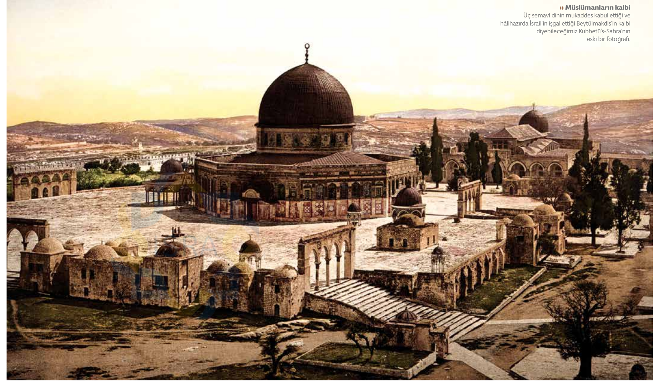
» Müslümanların kalbi Üç semavî dinin mukaddes kabul ettiği ve hâlihazırda İsrail'in işgal ettiği Beytülmakdis'in kalbi diyebileceğimiz Kubbetü's-Sahra'nın eski bir fotoğrafı.

Allah bana şifa verirse Beytülmakdis'e giderek namaz kılacağım" dedi. Bir süre sonra iyileşti. Yolculuğa hazırlandı ve selamlamak üzere Resulullah'ın eşi Hz. Meymûne'ye uğradı. Ona hastalığından ve adağından bahsetti. Hz. Meymûne de ona, "Burada otur, pişirdiğimden ye ve Resulullah'ın mescidinde namaz kıl! Ben Resulullah'tan şunu işittim ki, 'Orada (Mescid-i Nebevî) kılınan namaz -Mescid-i Harâm dışında- bütün mescitlerde kılınan bin namazdan daha faziletlidir" dedi.