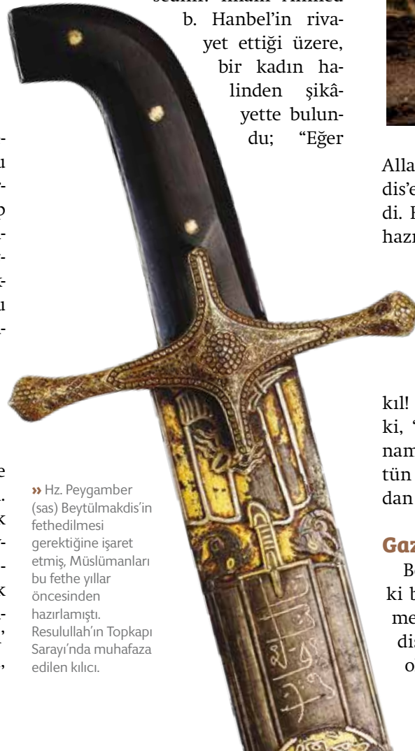
» Hz. Peygamber (sas) Beytülmakdis'in fethedilmesi gerektiğine işaret etmiş, Müslümanları bu fethin yıllarından hazırlamıştı. Resulullah'ın Topkapı Sarayı'nda muhafaza edilen kılıcı.

Üçüncü olay ise Medine döneminde yaşanmıştır. Burada, Allah kendisini hastalığından iyileştirdiğinde Beytülmakdis'te namaz kılmayı adayan bir hanım sahabeden bahsedilir. İmam Ahmed b. Hanbel'in rivayeti üzere, bir kadın hanımından şikâyetinde bulundu; "Eğer