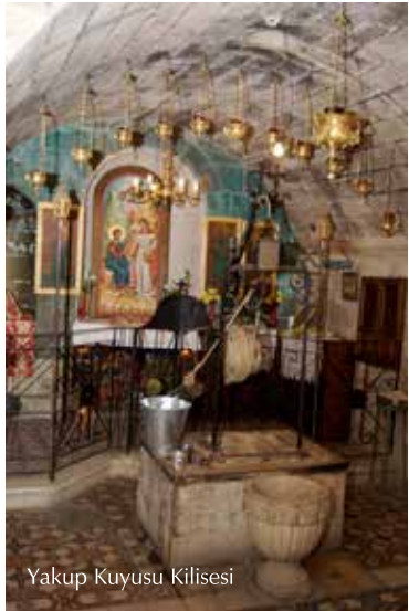
Yakup Kuyusu Kilisesi

Sebastiya Bizans döneminde piskoposların genel karargâhı idi. Yüksek şehrin (Al-Akropolis) güney yamacında Yuhanna Al-Mimidan'a (Yahya a.s) adanan ve tarihi Bizans dönemine uzanan bir kilise inşa edildi. Aziz Yuhanna onuruna eski köyün ortasında bir kilise daha yapıldı. Kilisenin temellerinin Bizans dönemine ait olduğu ve Haçlılar döneminde yeniden inşa edildiği sanılmaktadır. Daha sonra üzerine Hz. Yahya Aleyhisselam (Yuhanna El-Mimidan) onuruna bir cami inşa edildi.