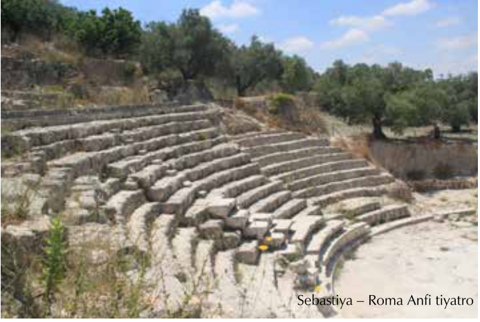
Sebastiya – Roma Anfi tiyatrosu