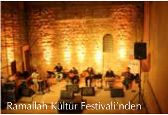
Ramallah Kültür Festivali'nden