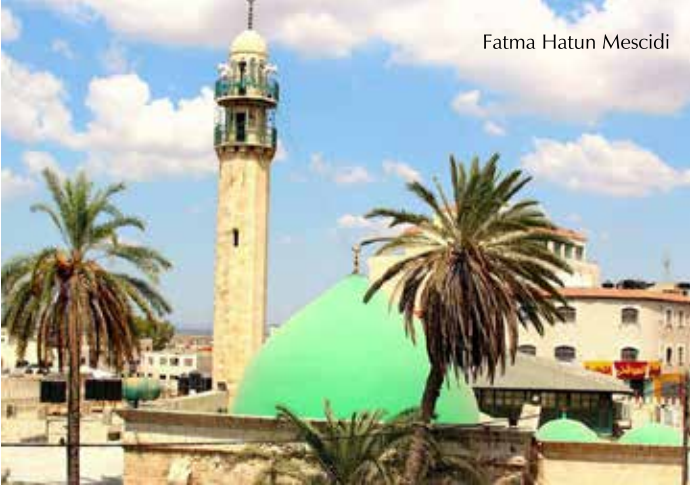
Fatma Hatun Mescidi

Cenin, tarihi M.Ö.14.Yüzyıl'a kadar uzanan ve Mısır'da bulunan Teli Al Amarna mektuplarında Cina ismi ile biliniyordu. Cenin, Roma döneminde Cina, Haçlılar döneminde de Büyük Cirin olarak adlandırılmıştır. Bugün Cenin güzelliği ile nefes kesen bir şehirdir. Şehrin etrafı, eteklerinde keçiboynuzu, incir ve hurma bahçelerinin bulunduğu tepeler ile sarılmıştır. Tarım ürünleri, meyve ve sebzesi ile ünlüdür.