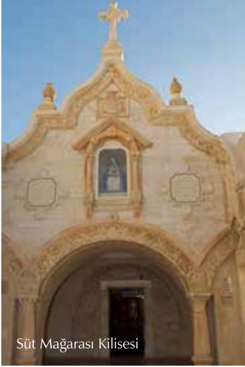
Süt Mağarası Kilisesi

Geleneklere göre Süt Mağarası, Hz. Meryem'in Mısır'a kaçmadan önce Herodot'un askerlerinden gizlendiği sırada bebek İsa'yı emzirdiği yerdir. Mağara, düzensiz olarak yumuşak beyaz bir kayanın içinde oyulmuştur. Beyaz renge dönüşen kayanın üzerine Hz. Meryem'in sütünden damlaların düşmüş olduğuna inanılır. Buraya Hristiyanlar ve Müslümanlar büyük bir önem verir. Süt rengi bu beyaz kayaların şifalı olduğu ve emzirme sütünü artırdığı bilinir.