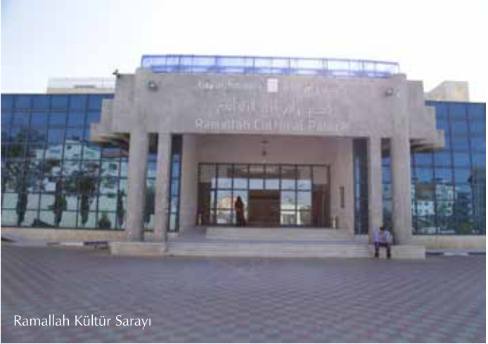
Ramallah Kültür Sarayı