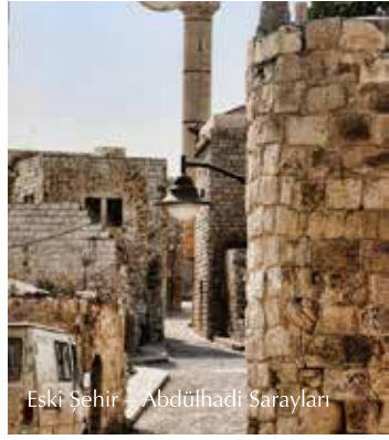
Eski Şehir – Abdülhadi Sarayları

eski adını taşımaktadır. Aynı şekilde M.Ö. 1468 yılında Asya üzerine yaptığı bir askeri saldırıda III Thutmose tarafından ele geçirilen Taanek'ten bir şehir olarak söz edilmiştir. Filistin üzerine M.Ö. 918 yılında I. Şeşonk tarafından yapılan saldırılar sonucunda şehir bir kez daha ele geçirilmiştir. Bu bölge Kutsal İncil'de birkaç kez Yuşa Bin Nun tarafından ele geçirilemeyen Kenan şehri olarak zikredilmiştir. Tarihçi Eusebius yerleşimden 4. yy'da büyük bir köy olarak söz etmiştir. Aynı şekilde Orta Çağ boyunca Haçlı kayıtlarında da bu köye işaret edilmiştir.