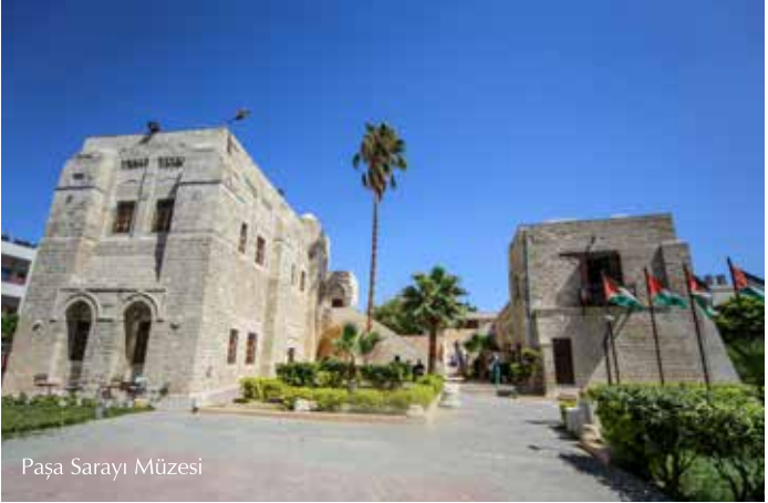
Paşa Sarayı Müzesi

Kilisenin tarihi Miladi dördüncü yüzyıla uzanır. Aziz Porphyrios'un öldüğü ve defnedildiği yerdir. Halen Ortodoks cemaati tarafından kullanılan kilise eski Gazze şehrinde yer alır.