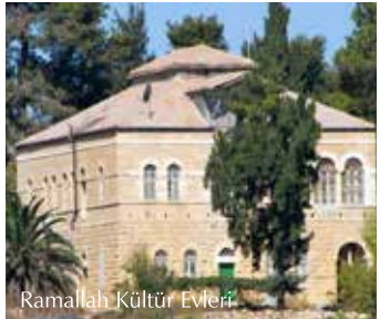
Ramallah Kültür Evi