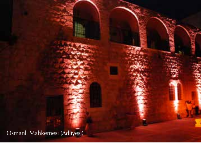
Osmanlı Mahkemesi (Adliyesi)