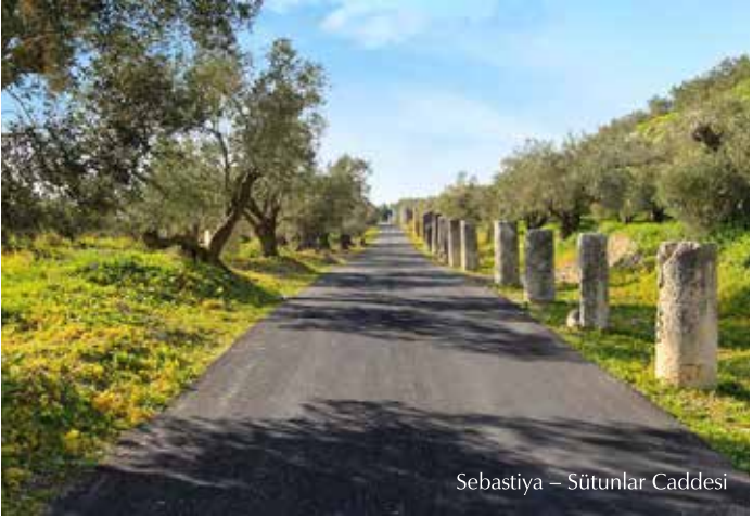
Sebastiya – Sütunlar Caddesi