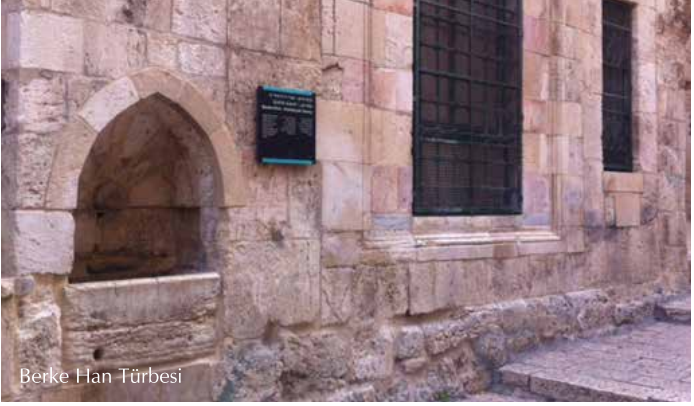
Berke Han Türbesi