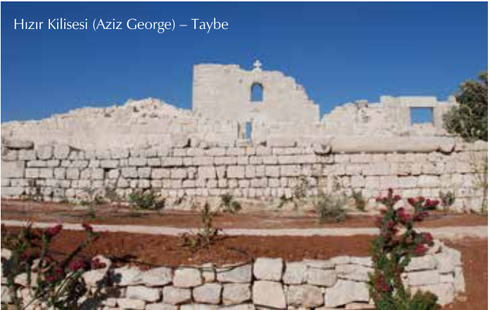
Hızır Kilisesi (Aziz George) – Taybe

Bu güzel şehir Ramallah'ın 12 kilometre kuzeydoğusunda çöl karası, Ürdün vadisi, Eriha ve Ölü denize bakan yüksek bir bölgede bulunmaktadır. Tarihi ve kültürü zengin bir şehirdir. Şehrin doğusunda Hızır Kilisesi (Aziz George) adıyla bilinen bir Bizans kilisesine ait izler hala kendini göstermekte. Ayrıca yapının içinde iyi durumda olan iki mescit, giriş revakı, merdiven, zemin mozaikleri parçaları ve vaftiz teknesi bulunuyor. Bu kilise Miladi 12. yüzyılda Haçlılar tarafından tekrar inşa edilmiştir. 2012 yılında Filistin Eski Eserler Dairesi tarafından, Bizans ve Erken İslam dönemine ait bir mezarlık keşfedildi. Beldenin meydanı yapılan restorasyon çalışmaları sonucu hizmete girdi ve içinde her sene Ekim ayında bir festival düzenlenmektedir.