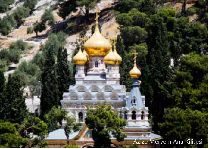
Azize Meryem Ana Kilisesi

çeken oval altın kubbeli kuleleriyle öne çıkan Azize Meryem Ana Ortodoks Rus Kilisesi'dir.