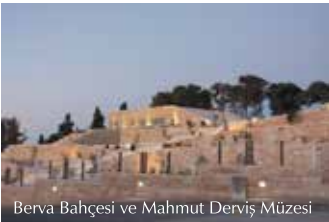
Berva Bahçesi ve Mahmut Derviş Müzesi