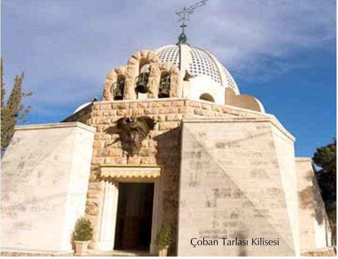
Çoban Tarlası Kilisesi