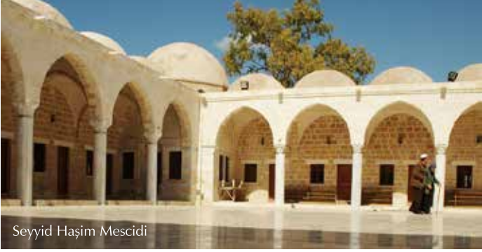
Seyyid Haşim Mescidi

El-Darac Mahallesi'nde yer alan cami, Gazze'nin en büyük ve en güzel camilerinden biridir. - Bir iş gezisi sırasında Gazze'de vefat eden- Peygamberimiz (s.a.v)'in dedesi Haşim bin Abdulmanaf'ın mezarı caminin kubbesinin altındadır.