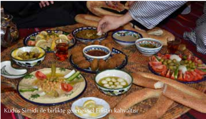
Kudüs Simidi ile birlikte geleneksel Filistin kahvaltısı