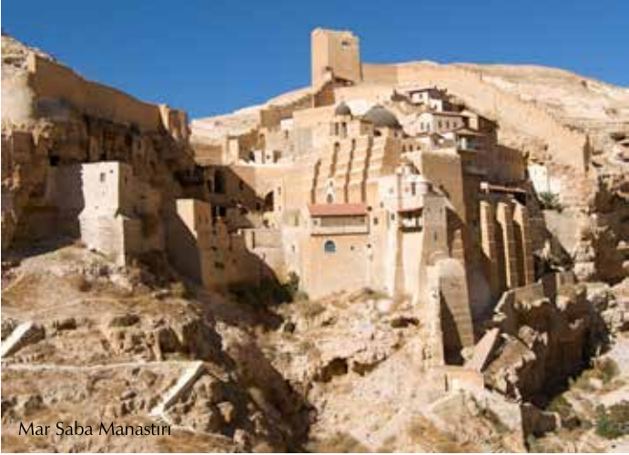
Mar Saba Manastırı

Beytullahim'in 15 kilometre doğusunda bulunan bu manastır, Kadron vadisine uzanan bir dağın tepesindeki kayanın üzerine inşa edilmiştir. İlk bakışta göze çarpan müthiş bir manzarası vardır. Rahipler burada İmparator Konstantin zamanından beri değişmeyen bir hayat tarzını muhafaza ederler. Manastır kendisine mahsus birçok geleneği halen korumaktadır. Bunların en önemlilerinden biri kadınların girişinin yasaklanmasıdır. Bu manastırı ruhbanlık yaşantısının başkanı Aziz Saba Bizans döneminde (Miladi 439-532) inşa etmiştir.