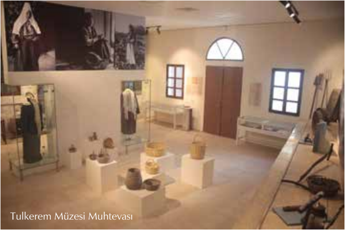
Tulkerem Müzesi Muhtevası