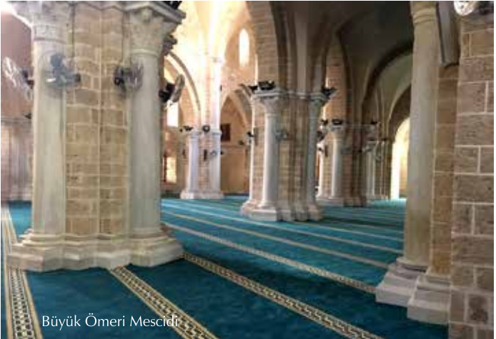
Büyük Ömeri Mescidi

Cami, Gazze şehrinin ortasında, Ömer el-Muhtar Caddesi'nin sonunda yer almaktadır. Camiye bu isim, raşit halifelerin ikincisi "Ömer bin Hattab" onuruna verilmiştir. Ömer Cami'in Marnas'a ait eski bir tapınağın üzerine inşa edildiği, sonra Bizans kilisesine ve daha sonra İslam fetihleri başlangıcında camiye