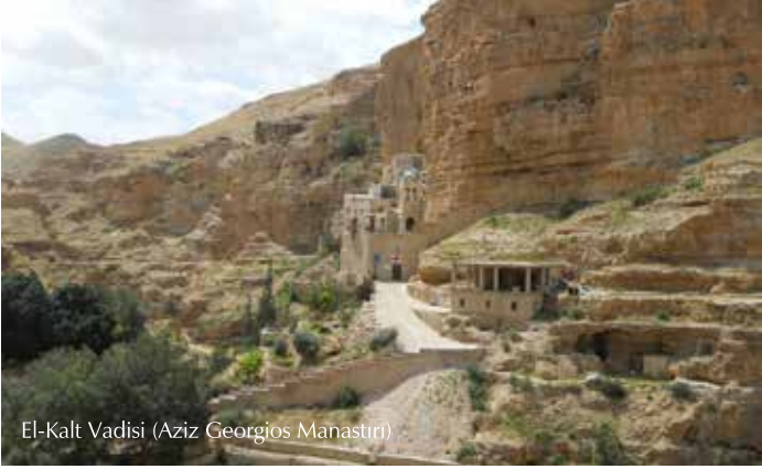
El-Kalt Vadisi (Aziz Georgios Manastırı)

El-Kalt vadisi bir yarık, doğal eğim ve yüksek kaya kenarlarından oluşmaktadır. Vadi, Kudüs ve Eriha arasında bulunan 45 kilometre mesafedeki tepeler boyunca uzanır. Miladi 3. Yüzyılda bu vadiye dindarlar yerleşmişlerdir. Bugün El-Kalt vadisi, özellikle kış mevsiminde bir eğlence ve dağcılık sporları merkezine dönüşmüştür. El-Kalt vadisindeki Aziz Georgios Manastırı etkileyici bir şekilde kayalardan yontulmuştur. Bina Miladi 5. veya 6. yüzyılda yapılmış, Perslerin Filistin'i istilası esnasında yıkılmıştır. Bugün mevcut olan Manastırın büyük kısmının restorasyonu 1901 yılında Yunan Ortodoks kilisesi tarafından yapılmıştır.