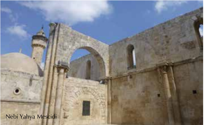
Nebi Yahya Mescidi