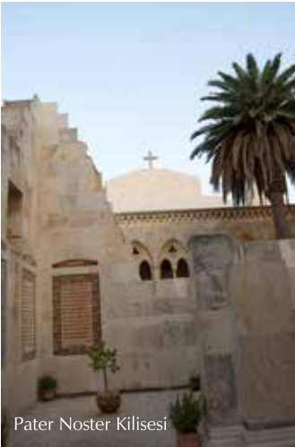
Pater Noster Kilisesi

Beit Anya, Kudüs şehrinin iki mil uzağında Zeytin Dağı'nın doğu eteğinde yer almaktadır. Burası, Mesih'in sevdiği El-Aizer ve kız kardeşleri Meryem ve Merta'nın evidir. Köy, Miladi 4. yüzyıldan beri El-Aizer'e nisbetle Ayzeriye adıyla tanınmıştır. Burası Hz. İsa'nın büyük mucizesini gerçekleştirdiği, ölümler arasında El-Aizer'i diriltiği mekândır.