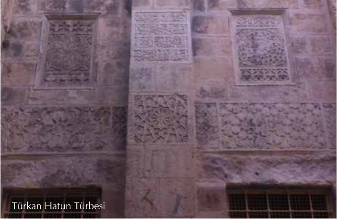
Türkan Hatun Türbesi

Mescid-i Aksa harem-i şerifinin Babu's-Silsele kapısından çıkarken sağ tarafta bulunan ve Memlûklülerin Kudüs'teki mimari tarzına uygun olarak inşa edilen türbe H.753- M.1352/3 yılında Özbek Selçukay oğlu Emir Taktay'ın kızı emire Türkan Hatun adına vakfedilmiştir ve aynı yıl içerisinde Kudüs'te vefat eden Türkan Hatun buraya defnedilmiştir.