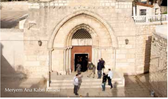
Meryem Ana Kabri Kilisesi