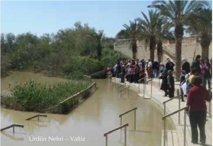
Ürdün Nehri – Vaftiz

Ürdün nehri Suriye'de deniz seviyesinden 1000 metre yükseklikteki El-Şeyh dağından deniz seviyesinin 400 metre altında bulunan ölü denize kadar akar. Ortalama genişliği 30 metreye ulaşan nehrin baştan sona kadar uzunluğu 251 kilometredir. Hristiyanlara göre Hz. İsa Vaftizci Yuhanna (Hz. Yahya (as)) tarafından Ürdün nehrinde vaftiz edilmiştir. Bu zamandan beri nehir Hristiyanlar için kutsal bir yer olmuştur. Her yıl birçok hacı vaftiz olmak için nehri ziyaret eder.