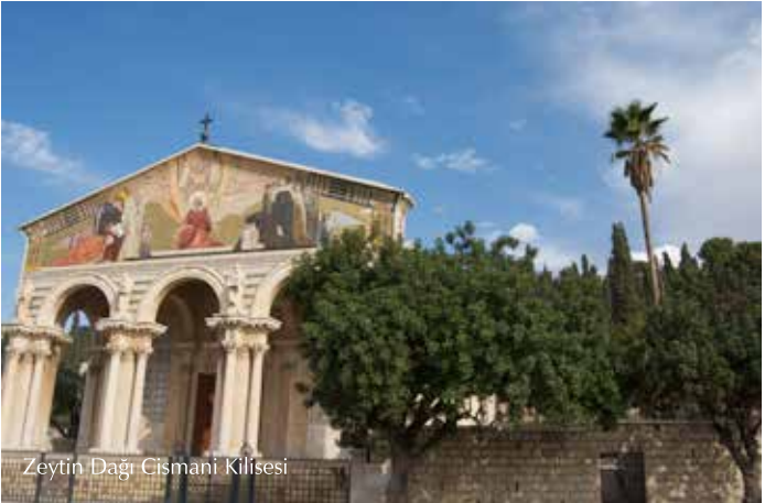
Zeytin Dağı Cismani Kilisesi

Cismani Bahçesi'nde yaşları 2000'i bulan dünyanın en eski zeytin ağaçları bulunmaktadır. Hz İsa tarafından dua ve tefekkür için tercih edilen bir mekân olan bu bahçe, Hz İsa'nın son gecesinde etrafında dua ettiği bir kayayı da barındırır.