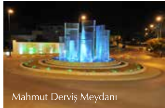
Mahmut Derviş Meydanı